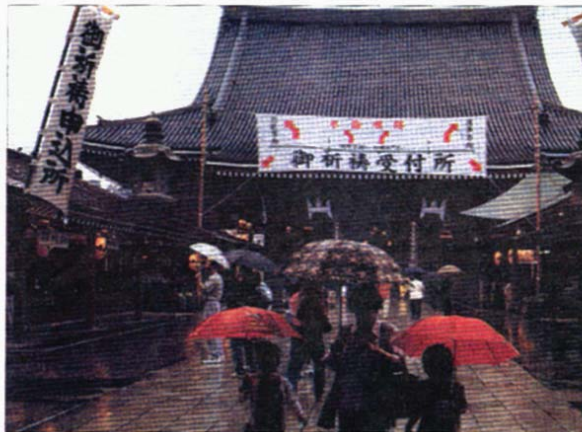
Podczas spotkań będzie okazja poznać Japonię dawną i współczesną.

W programie tegorocznej imprezy znajdzie się również miejsce na dyskusję poświęconę wzajemnym kontaktom gospodarczym pomiędzy